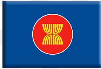
Şekil 4.5 ASEAN Bayrağı

ASEAN bayrağı, ASEAN üye devletlerinin birlik ve beraberlik içerisinde, ASEAN ilke ve kurallarına bağlılığı simgeleyen, dinamik, barışçıl, istikrarlı ve bütünleşmeyi temsil etmektedir. ASEAN bayrağındaki renkler ve on adet bulunan padi saplarının varlığı ise ASEAN logosunda olduğu gibi üye ülkelerin bayraklarındaki ana renklerden oluşmakta ve aynı anlamları taşımaktadırlar (ASEAN, 2020, s. ASEAN Flag).