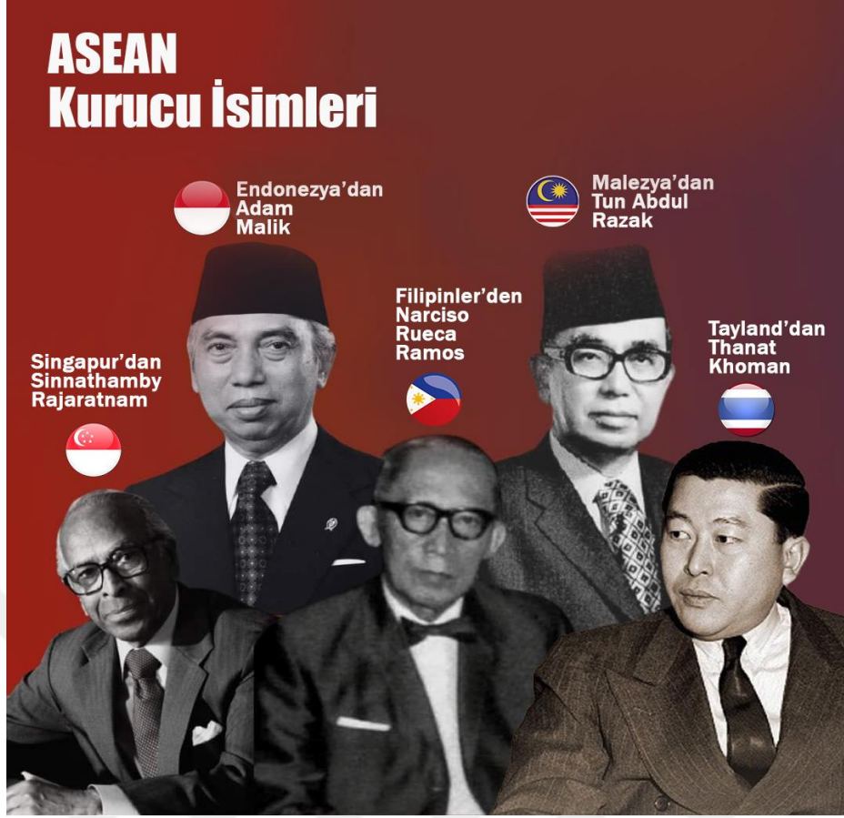
Şekil 4.1 ASEAN Kurucu İsimleri

Bu beş bakan, bugün ASEAN'ın kurucu isimleri olarak bilinmektedirler. İmzaladıkları bu belge "ASEAN Deklarasyonu" ya da "Bangkok Deklarasyonu" olarak bilinmektedir. Deklarasyon beş maddeden oluşan kısa ve net bir belgedir. ASEAN'ın kurulma amaçlarına baktığımızda bunlardan biri de komünizmden Güneydoğu Asya Bölgesini korumaktır. İkinci Dünya Savaşı'ndan sonra komünizm Güneydoğu Asya Bölgesinde ciddi bir tehdit ve endişe unsuru olarak görülmüştür. Sovyetler Birliği'nin ve Çin'in komünist rejimleri, Güneydoğu Asya bölgesinde de komünist partilerin kurulmasına yardım etmişlerdir. Güneydoğu Asya bölgesinde bulunan komünist partilerin hedefleri, bu bölgenin siyasi yapısına nüfuz ederek komünist ideolojiyi hâkim kılmaktır. Çin'in desteği ile Güneydoğu Asya bölgesinde güçlenen komünist partiler, bu coğrafya üzerinde birçok karışıklığa sebebiyet vermiştir. Güneydoğu Asya bölgesindeki komünist partiler; çatışmalar, isyanlar, ayaklanmalar, orman yangınları ve trenlerin raydan çıkması gibi birçok karışıklığa ve can kayıplarına neden olmuşlardır. Çin buradaki komünist hareketlere mali destek vererek bölgeyi olumsuz anlamda hareketli tutmuştur. Bu nedenle, Güneydoğu Asya bölgesinin bağımsızlığı ve güvenliği tehlike altındaydı. Komünist partiler nedeniyle bölge ülkeleri birbirleriyle çatışma halindeydi (Singh &