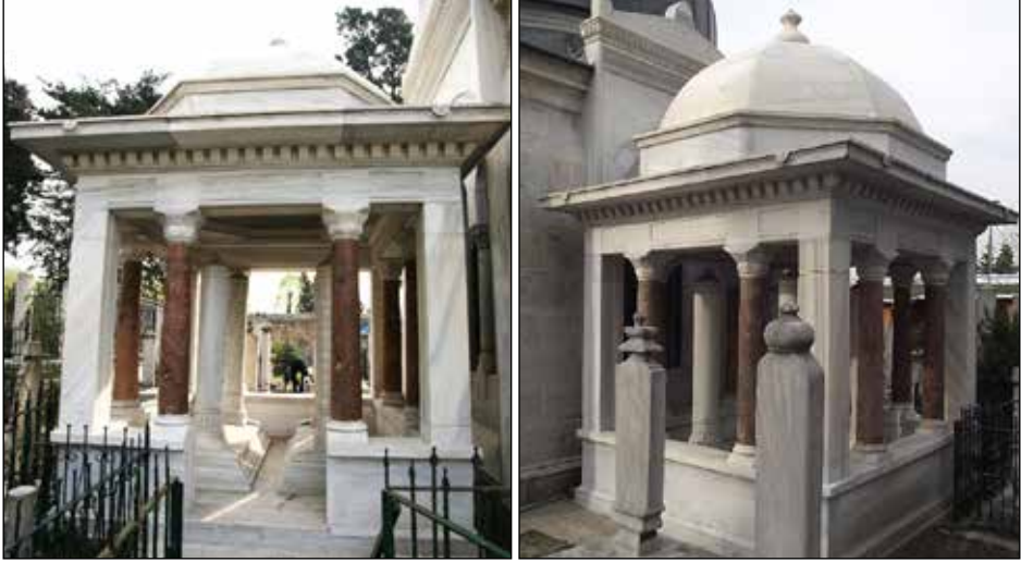
G. 5: Abidin Paşa Türbesi Genel Görünüş.

Abidin Paşa Türbesi 336 cm eninde ve 19 cm yüksekliğinde bir kaide üzerine oturmaktadır (G. 3). Kaidenin üzerinde türbeyi çevreleyen 36 cm eninde ve 60 cm yüksekliğinde bir korkuluk bulunmaktadır. Korkuluk, doğu cephede yer alan giriş açıklığı nedeniyle kesintiye uğramıştır. Korkuluğun köşelerinde 30 cm eninde ve 182 cm yüksekliğinde kare sütunlar vardır. Kare sütunlara, silindirik sütunların kaide ve başlık bölümlerine denk gelecek şekilde silmeler yapılmıştır.