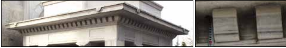
G. 7: Saçak ve Konsollardan Detay (M. Bulut, 2015).

Lento üzerinde yer alan silme kuşağının üzerinde antik mimarlıktaki metopları hatırlatan dışa taşıntılı konsollar bulunmaktadır 12 . Her cepheye düzenlenen 24 konsolun üzerinde düz bir saçak yer almaktadır (G. 7). Saçağın her cephesine köşelere yakın bölümlerine yarım daire silmelere sahip çörtlenler düzenlenmiştir. Saçağın üzeri, yağmur sularının akabilmesi için dışa doğru meyilli olarak yapılmıştır.