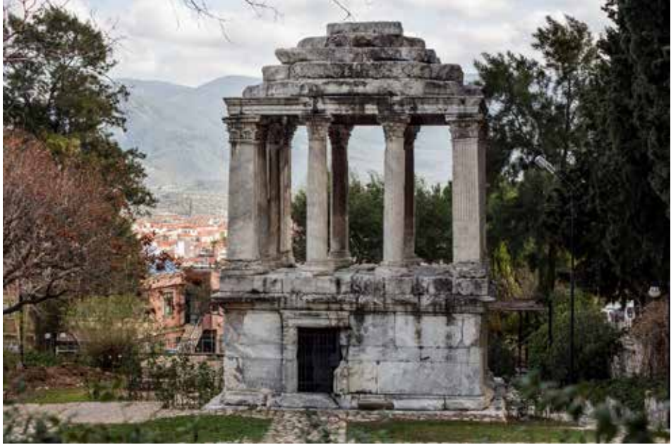
G. 1: Milas Gümüşkesen Anıtı Genel Görünüş.

Erken Dönem Osmanlı türbelerinde sıkça karşımıza çıkan Baldaken şeklindeki türbeler hem Anadolu hem de Balkan coğrafyasında inşa edilmiştir 5 . Abidin Paşa Türbesi on iki adet sütunun taşıdığı üst örtüsüyle dikkat çekmektedir. Sütunların üzerine lento düzenlenmiş ve sekizgen kasnak üzerinde yükselen sekiz dilimli kubbenin dilimleri lento üzerine yerleştirilmiştir. Osmanlı döneminde mermerden bir alemlerle sonlanan sekiz dilimli kubbe yapısının bir iki örneği görülmektedir. Bu kubbe formu farklı isimlendirmelerle tarif edilmiş ve formun kaynağı hakkında çeşitli görüşler ileri sürülmüştür.