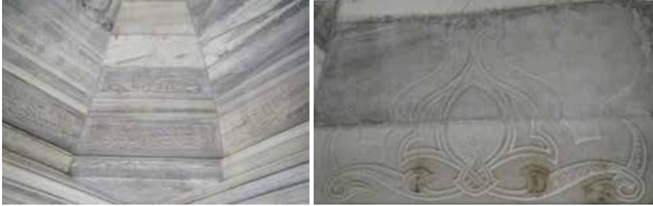
G. 10: Kubbe Üzerinde Kartuş ve Palmet Süsleme Detayları (M. Bulut, 2015).

Kubbe iç yüzünde kasağın alt bölümlerine sekiz kartuş hâlinde celî sülüs hatla “Fussilet Suresi’nin 30 ve 32. ayetleri” yazılmıştır (G. 11) :