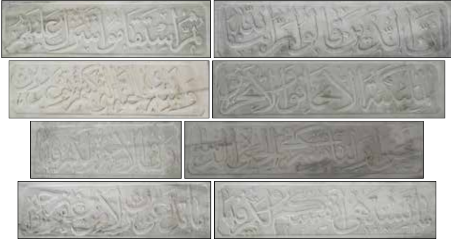
G. 11: Kasnak İç Yüzeyi Kitabe Detayları (M. Bulut, 2015).

Türbe içerisinde iki adet pehleli mezar bulunmaktadır. Güneydoğu yönündeki mezar Veysel Paşa'ya aittir. Kenarları silmeli, üst bölümü ise iki yana pahlı olan pehle; 100x198 cm ölçülerinde bir kaide üzerine oturmaktadır. Baş ve ayak taşlarının altına pehnenin pahıyla paralel olan kademeli silmeler düzenlenmiştir. Şahidelerin kare kaideleri pehle ile yekparedir. Kaide köşelere düzenlenen prizmatik üçgenlerle kare formu on altı gene dönüştürülmüştür. Silindirik şahidelerin alt bölümlerine on altı mukarnas yapılmış, başlık bölümleri ise yine on iki prizmatik üçgenle geçilmiştir. Celf ta'lik hatla işlenen dokuz satırlık kitâbesinde aşağıdaki ibareler yazılıdır: