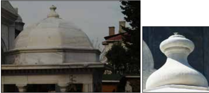
G. 8: Sekizgen Kasnak ve Kubbe Detayları (M. Bulut, 2015).

Türbeyi örten kubbe, üst bölümü silmeli, 0,50 m yüksekliğinde bir kasnak üzerine oturmaktadır. Sekizgen kasnağın üzerinde de yine sekizgen şekilde yapılmış bir kubbe bulunur. Kubbe, mermer malzemeye yapılmış bir alemle nihayetlenmektedir (G. 8).