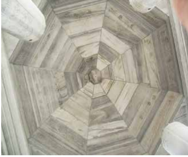
G. 9: Kubbe Üzerinde Kartuş ve Palmet Süsleme (M. Bulut, 2015).